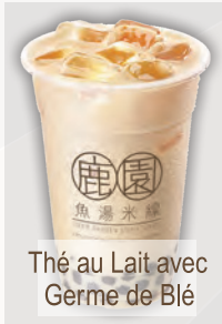
Thé au Lait avec Germe de Blé