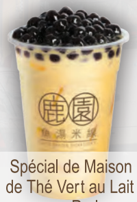
Spécial de Maison de Thé Vert au Lait avec Perle