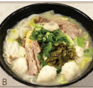
B Moutarde Marinée et Poivre + Tranches de Bœuf Braisé & Boulettes de Poisson + Nouilles de Riz 酸菜胡椒魚湯 + 牛腩、魚蛋 + 粗米線