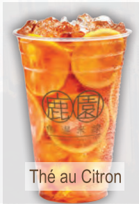
Thé au Citron