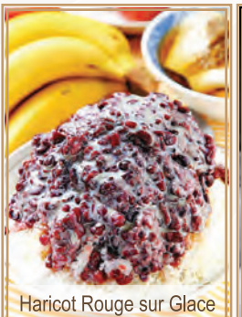
Haricot Rouge sur Glace