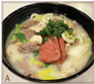
A Base de Soupe Originale + Tranches de Bœuf Cuit & Pain de Jambon Haché + U-don 原味魚湯 + 滑牛、午餐肉 + 烏冬