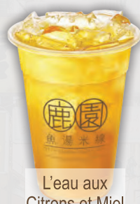
L'eau aux Citrons et Miel