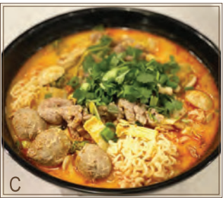
C Laksa Malaisien + Tranches de Bœuf Cuit & Boulettes de Bœuf + Nouille Instantanée 馬來喇沙湯 + 滑牛、牛丸 + 出前一丁