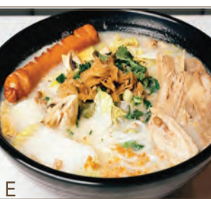
E Poisson Déshydraté et Porc Émincé au Style Chaozhou + Tranches de Bœuf Braisé & Saucisse Assaisonnée + Nouilles de Riz 潮式方魚肉碎魚湯 + 牛腩、脆皮腸 + 粗米線