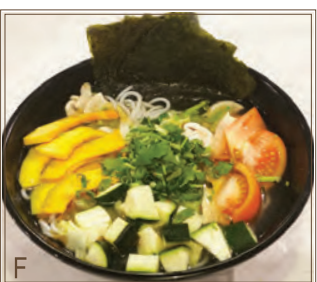
F Bouillon de Poulet + Tranches de Citrouille & Zucchini + Nouilles de Riz 清雞湯 + 南瓜片、意大利瓜 + 粗米線