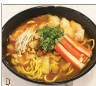
D Tom Yum Gong Thaïlandais + Filet de Poisson & Imitation de Crabe + Nouilles de Riz 泰式冬陰功湯 + 鮮魚片、蟹柳 + 粗米線