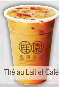
Thé au Lait et Café