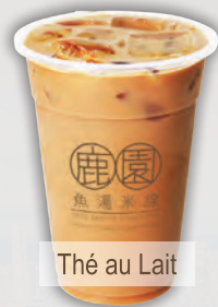
Thé au Lait